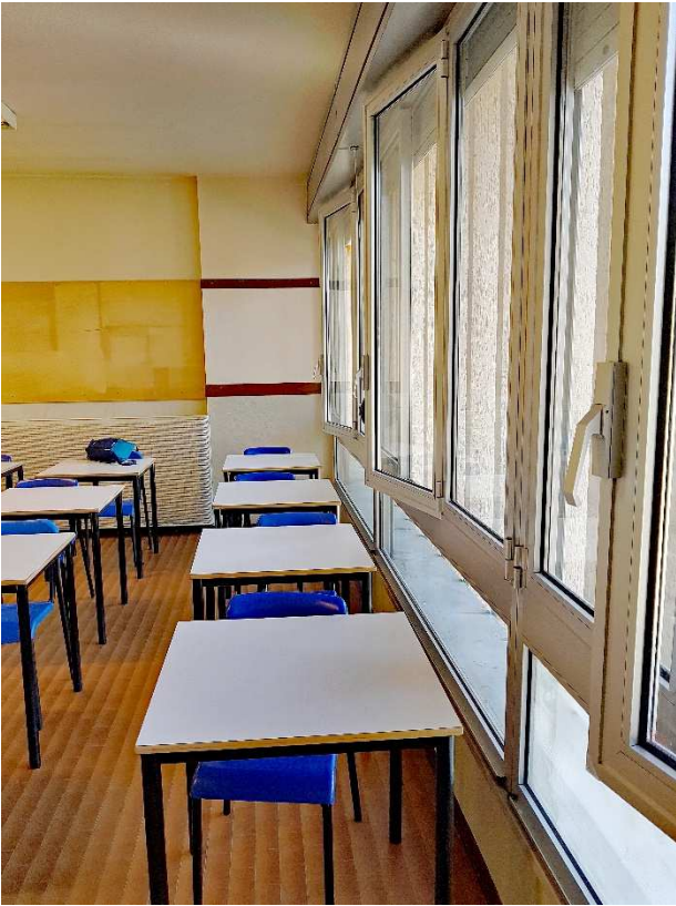
Foto dopo dell'intervento