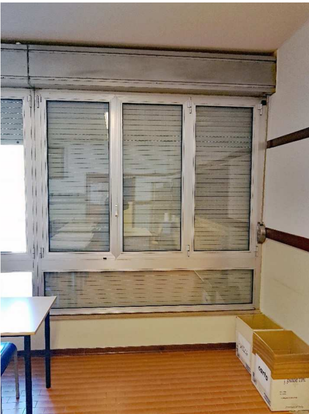
Foto dopo dell'intervento